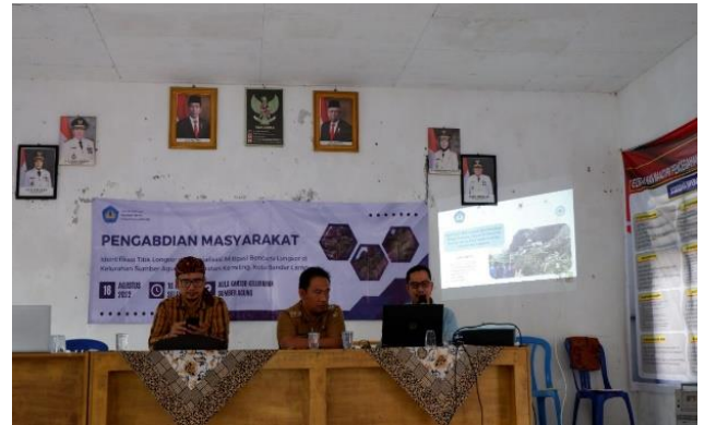
Gambar 5. Pemaparan Materi Sosialisai Mitigasi Longsor

Selanjutnya dilaksanakan sosialisasi mitigasi bencana yang diawali dengan pembagian kuisisioner pertama yang bertujuan untuk melihat tingkat wawasan warga terhadap bencana longsor serta upaya mitigasi yang dapat dilakukan, dan dilanjutkan dengan pemaparan materi mengenai mitigasi bencana longsor serta titik potensi longsor di Desa Sumber Agung berdasarkan pemetaan yang telah dilakukan pada penelitian sebelumnya. Selanjutnya dari pemaparan yang telah dilakukan dilanjutkan dengan pengisian kuisisioner kembali sebagai parameter pemahaman warga Sumber Agung mengenai kesadaran mitigasi bencana longsor.