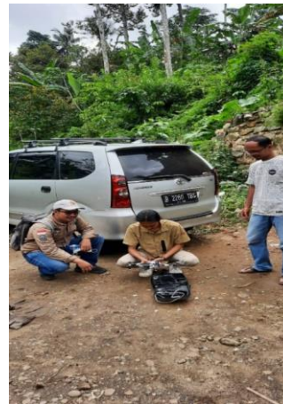
Gambar 3. Kegiatan Pemetaan Titik Potensi Longsor dengan Foto Udara

Pada peta yang ditunjukkan pada Gambar 4 terlihat bahwa pada daerah penelitian terdapat lima titik yang berpotensi longsor. Selain itu, tutupan lahan pada peta tersebut sebagian besar merupakan pemukiman padat di utara sampai ke tenggara. Titik rawan longsor di simbolkan dengan titik berwarna oranye, sebenarnya pada titik 1 sudah terjadi longsor, hal ini karena ada perbedaan ketinggian permukaan tanah yang cukup