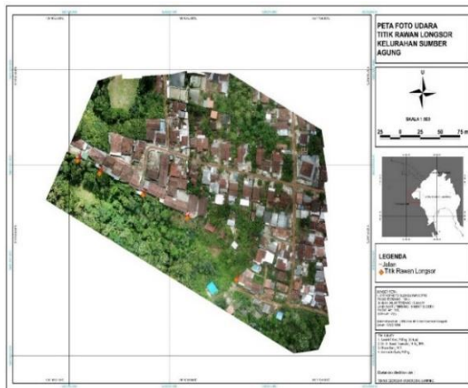
Gambar 4. Peta Foto Udara Titik Rawan Longsor

signifikan. Selanjutnya pada titik 2-5 merupakan titik rawan tetapi belum atau tidak terjadi longsor. Tetapi memiliki ciri-ciri kenampakan yang mirip, dimana lahan terbangun ada diatas lahan yang masih berupa vegetasi tetapi ada perbedaan yang cukup tinggi dalam ketinggian permukaannya dan kelerengannya yang sangat curam. Belum lagi, tidak ada penahan agar tanah tidak terjadi deformasi.