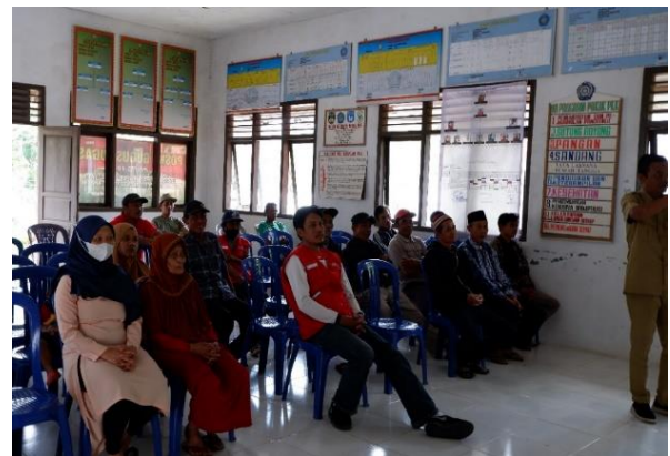
Gambar 6. Warga menyimak Pemaparan Materi Sosialisai Mitigasi Longsor

Kemudian pada akhir acara dilakukan penyerahan hasil pemetaan titik longsor yang telah dilakukan menggunakan foto udara. Dari hasil pemetaan ini diharapkan bagi masyarakat yang berada di sekitar titik area yang berpotensi longsor lebih bersiap siaga dan memahami mitigasi yang perlu dilakukan untuk menghindari dampak longsor yang terjadi nantinya.